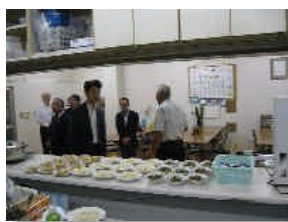
食堂にてちょうど夕食の準備中