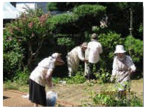
石碑の前にもきれいな花壇ができました

平成二十七年七月十四日と二十三日、若葉更女の皆様が婦性会の前庭をきれいな草花で飾っていただきました。見違えるほど美しくなりました。当日は、猛暑にもかかわらず丁寧な作業をしていただきましたこと、感謝する術はありません。