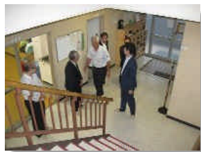
階段下にて掲出物の説明を聞かれる