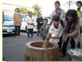
ちびっ子も在会者も みんなにも つつい笑顔がこぼれます。