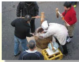
皆さん やる気満々です。