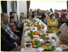
餅つきの後は、集会室で。 つきたての餅に また笑顔が。