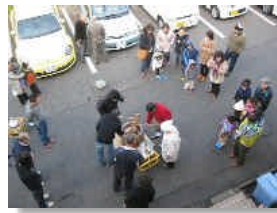
餅つきは 婦性会の裏庭で

子どもたちの嬉々とした顔がとても印象に残る一日となりました。また来年のその時が来るのが今から待ちどろしいですね。