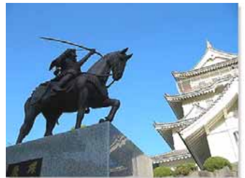
千葉城 と 大空に鎗矢を放つ『飛躍』の像