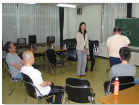
自己紹介の仕方や挨拶の仕方など参加者も実際にやってみました 笑いもあり、楽しい勉強会でした