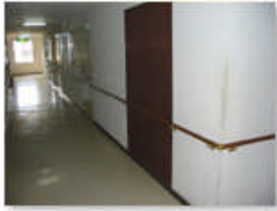
階段、2F廊下に手すりを設置しました。

これから、被保護者に高齢者及び障害を抱えた方々が増えてくることが予想され、今回その方々に対応するため工事を行いました。ご援助に厚く感謝申し上げます。