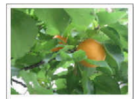
本会の前庭の杏子の木 杏子の花言葉は『愛する者に対する贈り物』だそうです。