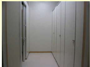
専用スリッパに履き替えて従来、男子職員用トイレを使っていたいました。不便解消。

本会は男子を保護するという性格上女子用のトイレがありませんでした。そのため、男子職員用トイレを便宜的に使用していただき、その間職員は二階の被保護者用トイレを使っていました。今般、ガス風呂化に伴い電気温水器を撤去し女子専用のトイレを増設するにいたしました。これからは女性も更に安心して使ってください。