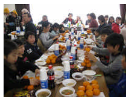
餅つきの後は、集会室でつくたての餅は格別です。