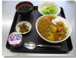
ある日の夕食 コロッケカレー、ミニサラダ、わかめスープ デザートにはゼリーも

保護委託された入会者の食事提供は、更生保護の大きな柱の一つです。栄養バランスのとれた食事を提供し、社会生活の基本となる規則正しい食事をとってもらうため調理員は日々腕を振るっています。 本会では、アンケートで入会者の好みの献立や料理を募り適宜メニューにとりいれています。