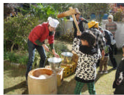
餅性会の庭で餅つきちびっ子の参加も多く賑います。

餅性会でも、地域の皆様や在会者、BBS会の皆様が餅性会の庭で毎年楽しく餅をつきます。子供たちも嬉々として杵を振り上げて餅をつきました。その後、集会室にて、更生保護女性会や会員様の協力を得て食事の準備をし、皆で頂きました。皆様有難うございました。