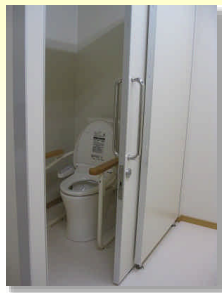
温水便座です冬場も快適です。